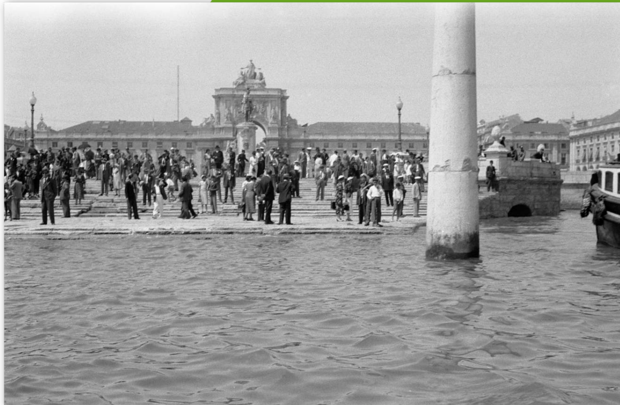
Cais das Colunas • s/d