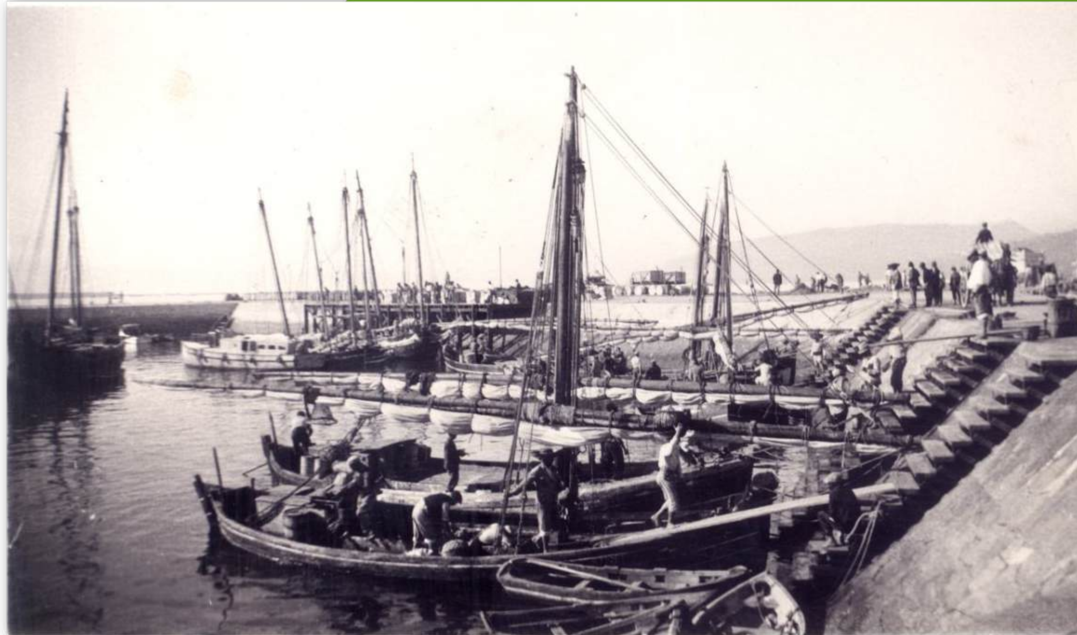
Carregamento de conservas , no porto de Setúbal • s/d