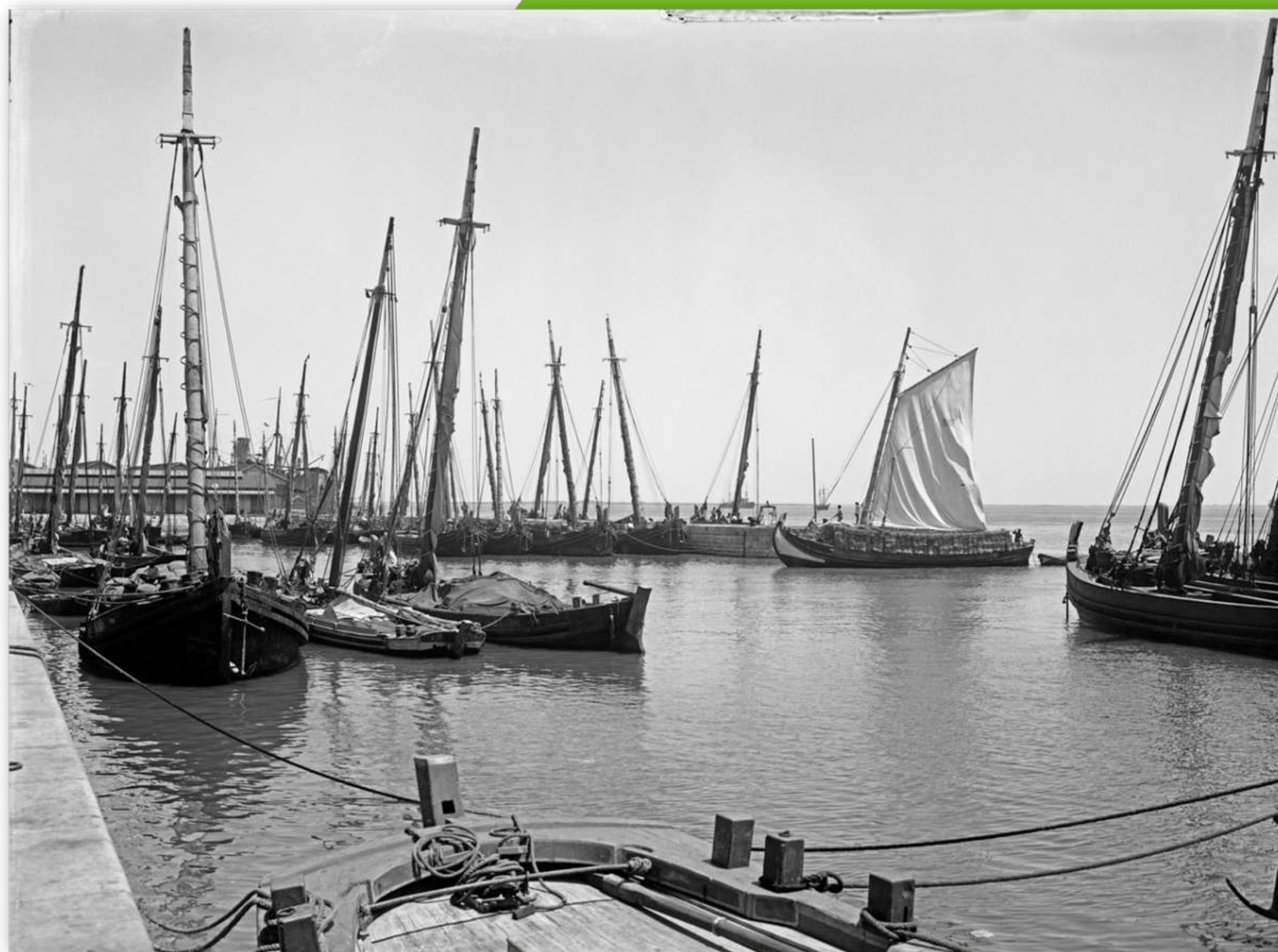
Doca da Alfândega • 16/07/1917