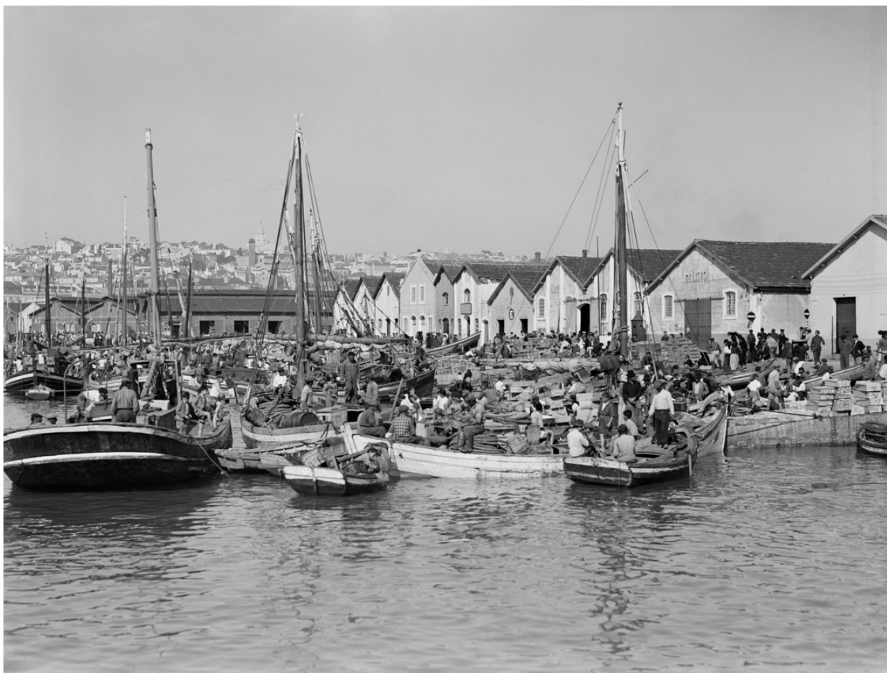
Aspeto de descarga de peixe na Ribeira Nova [meados dos séc. XX]